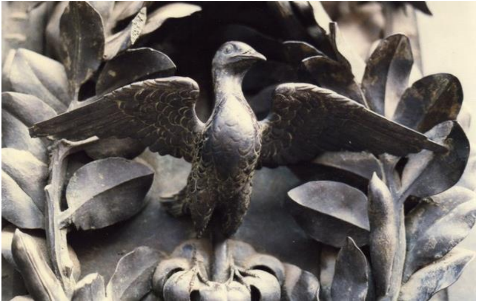
detail van één van de deuren van het Baptisterium in Florence